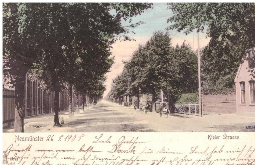
Altonaer Straße in Neumünster (links Eisenbahn Ausbesserungswerk) um 1908

In den Ausstellungen wird die Geschichte der ersten Kunststraße in Schleswig-Holstein im Spannungsfeld von Verkehrsentwicklung, Denkmalschutz und Alleenschutz dargelegt. Gezeigt werden historische und aktuelle Fotos, Dokumente und Karten. Dabei wird auf die Besonderheiten der Chaussee in Bezug auf die jeweiligen Ausstellungsorte eingegangen und es werden Anregungen gegeben, wie die Geschichte der bedeutenden historischen Wegeverbindung vor Ort wieder erlebbar gemacht werden kann.