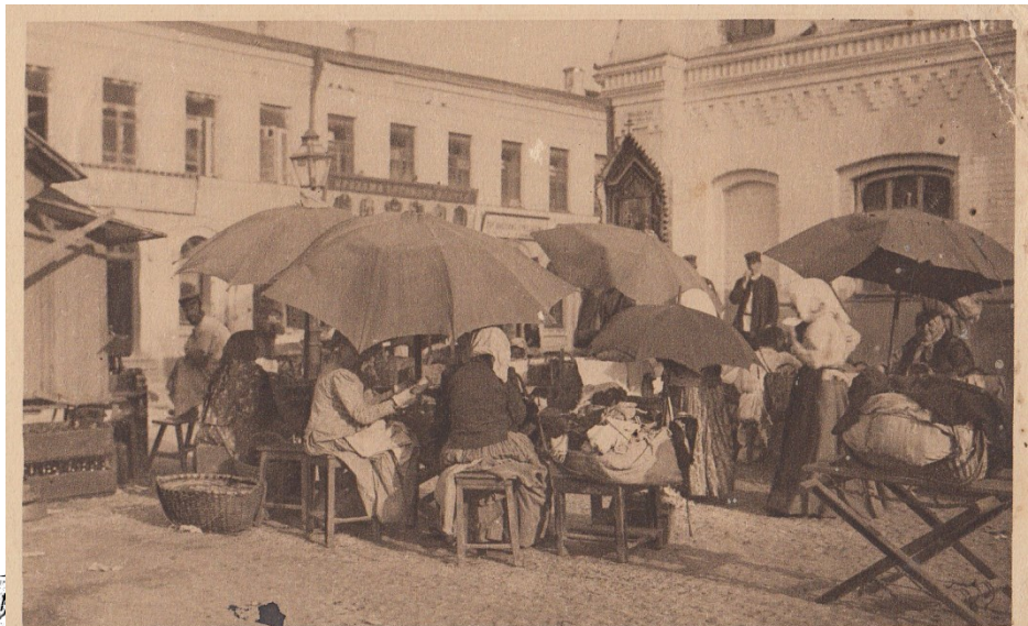
700. RUSSISCHE TYPEN - Markt.