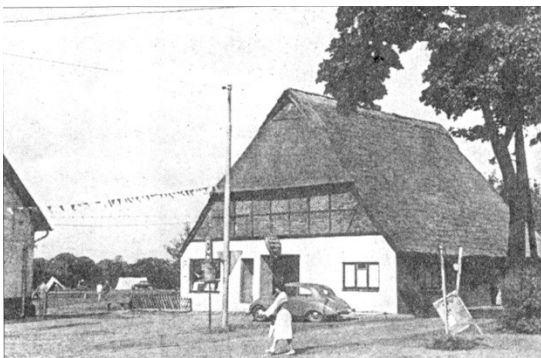
Campingplatz nach 1954

Nach dem Zweiten Weltkrieg war hier eine Tankstelle, Campingplatz (seit 1954) seit 1972 ein Kino, ein Chinesisches Restaurant,