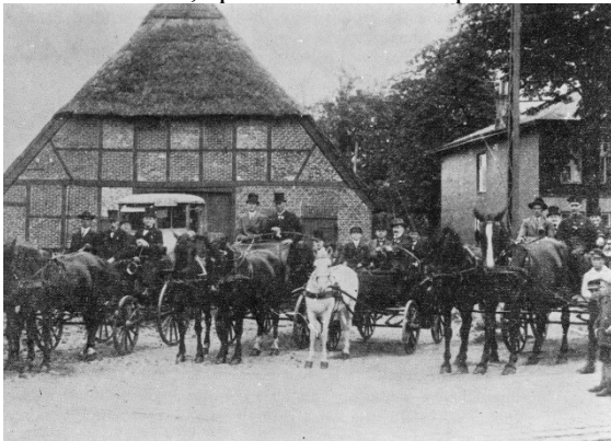
1922 feierliche Ausfahrt

Hier gab es ein Restaurant, Festsaal, Ausspahn, Kaffee-Garten, später auch Tennisplätze.