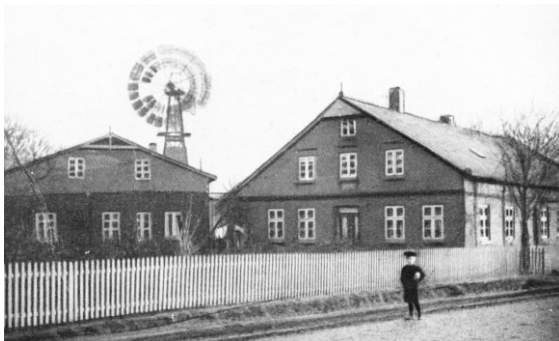
Das Schulgebäude 1866 bis 1887

An dieser Ecke stand früher das alte Schulhaus gebaut im Jahre 1769, welches 1865 abgebrochen wurde. Es hatte lange nur einen Klassenraum für alle Schüler in Eidelstedt. Dafür wurde ein neues Gebäude errichtet.