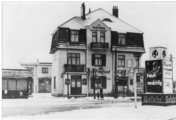
Später entstand hier das Gasthaus Wartburg.